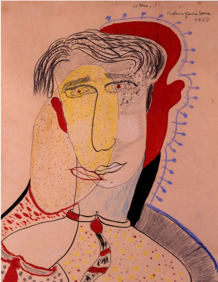
Federico García Lorca El beso , 1927. Casa Museo de los Tíros, Granada

Beskriv billedet El beso af Federico García Lorca, side 73 i Viva la vida . Du skal bruge mellem 3-5 adjektiver.