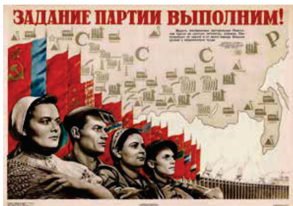
Plakat fra 1957.

Der står: 'Vi vil fuldføre partiets opgaver' – "De opgaver, som er fastlagt af Partiets Centralkomite i den sjette femårsplan, er enormt omfattende. De vil kræve store anstrengelser og intens arbejdsindsats fra partiet og hele folket".