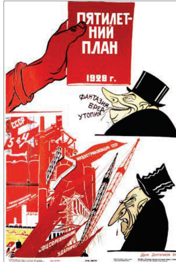
Plakat fra 1928

Lav en analyse af de to sovjetiske propagandaplakater nedenfor.