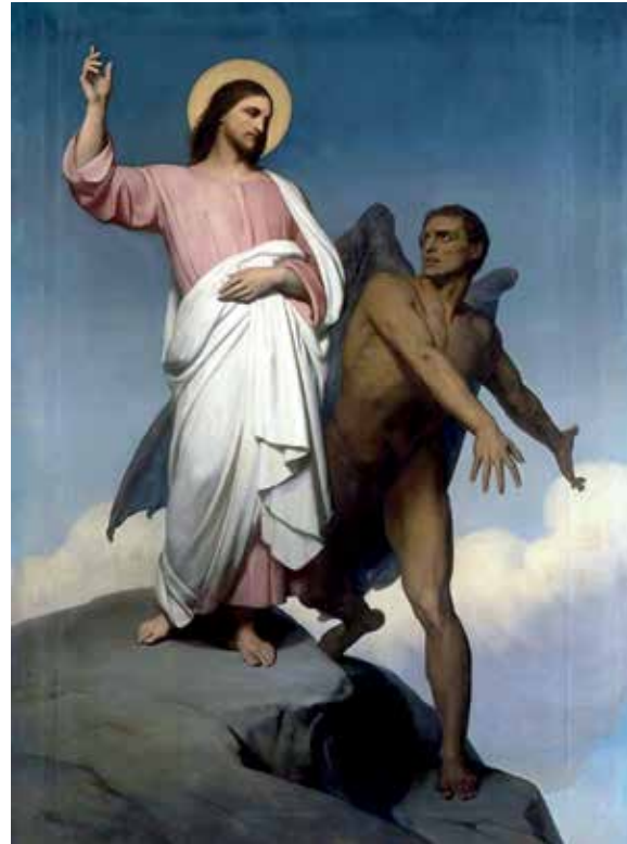
Motiv fra Det Nye Testamente: Djævelen frister Jesus i ørkenen . Maleri af Ary Scheffer (1854).