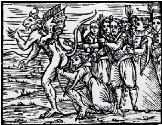
Illustration fra Guazzos Compendium maleficarum (1608).