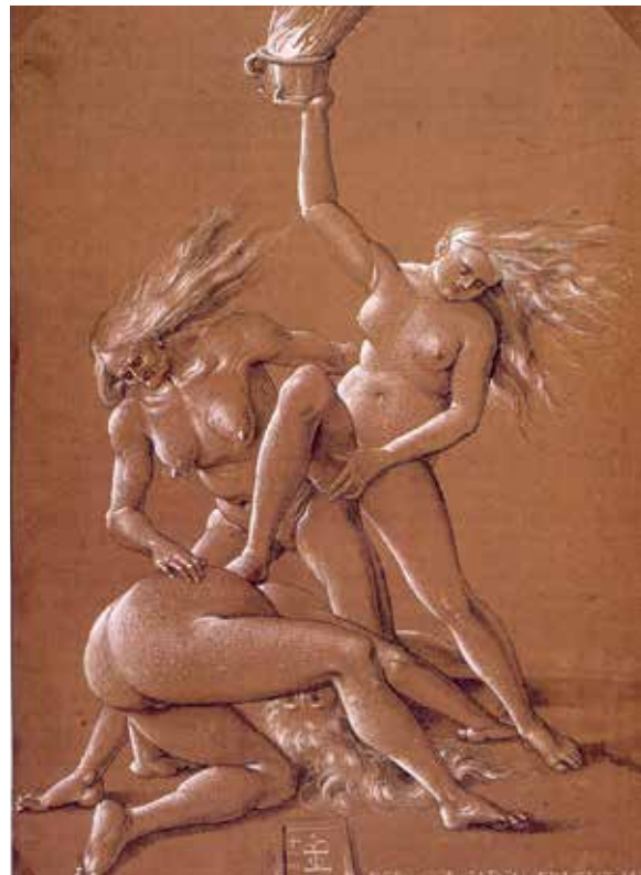
Hans Baldung Grien (1514): Tre hekse springer buk . Kvinden nederst ser verden omvendt, fordi alt i heksenes verden er vendt på hovedet.