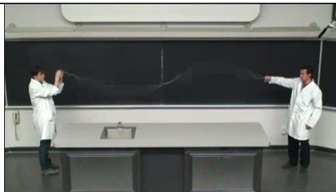
Du kan her se en kort video, der illustrerer svingningsmønstrene for en streng.

Hvis vi slår en guitarstreng an, så frembringer vi på samme måde bølger, der bevæger sig frem og tilbage langs strengen over længere tid, idet de reflekteres, der hvor strengen er fastgjort (stol og hoved). Uanset, hvor kompliceret bølgen er, så vil den gentage sig selv netop, når den har gennemløbet strengen to gange (frem og tilbage), og hermed frembringes et periodisk mønster. På samme måde vil den frembragte lyd være periodisk og velklingende – der frembringes musik!