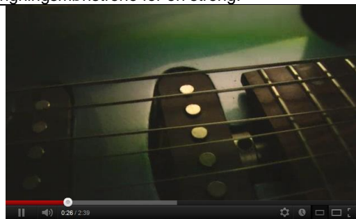
Du kan her se en guitarstreng i slowmotion

Lydbølgerne interferer med hinanden, og kun de lydbølger, der giver anledning til stående bølger, har betydning for den lyd vi hører, fordi de andre dør ud. Der findes altså en samling stående bølger, som tilsammen frembringer lyden af de toner / den musik som guitaristen spiller Grundtonens og overtonernes amplituder afhænger af, hvordan strengen anslås – både hvor på strengen og kvaliteten af anslaget (let/hårdt etc.). Frekvenserne af lydbølgerne vil være de samme som frekvenserne af bølgerne på strengen.